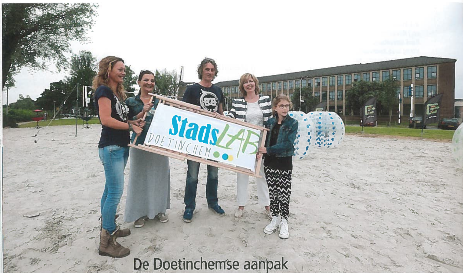
De Doetinchemse aanpak